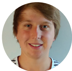
Pavel Zapadlo Dohalice

Dohalice zahájily zimní přípravu již v lednu s výhledem třech tréninkových jednotek týdně. Cílem bylo nabrat co největší fyzickou zdatnost k hernímu stylu nového trenéra. Na přelomu února a března vše vyvrcholilo soustředěním, při kterém jsme sehráli i první přípravný zápas, který byl především o zkoušce něčeho „jiného“. S přípravou a přístupem hráčů jsme nadmíru spokojeni a věříme, že se vše promítne i do zápasového rytmu.