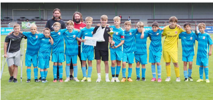
LHOTA POD LIBČANY - VÍTĚZ SPORT FOTBAL OP MLADŠÍ ŽÁCI