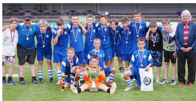
SK SMIŘICE - VÍTĚZ HRADECKÉHO POHÁRU MLADŠÍCH ŽÁKŮ LADISLAVA ŠKORPILA 2024