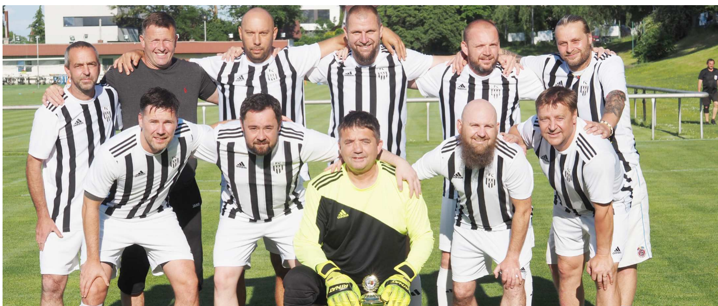
FC NOVÝ HRADEC KRÁLOVÉ - VÍTĚZ JAKO LIGA GENTLEMANŮ U-40