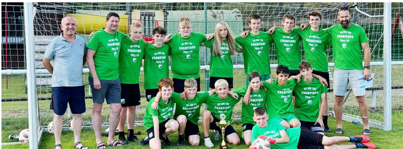
KUNČICE/RMSK CIDLINA C - VÍTĚZ BELSPORT OP STARŠÍ ŽÁCI