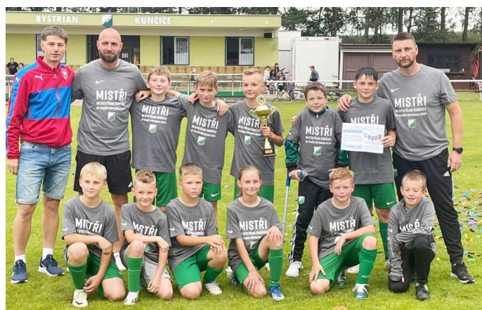
KUNČICE - VÍTĚZ BELSPORT OP STARŠÍ PŘÍPRAVKA